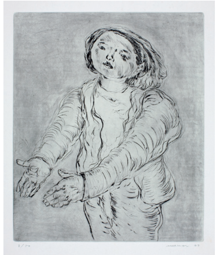
3. Junge mit ausgetreckten Armen Kaltnadelradierung, 1971 45,5 x 47,7 cm