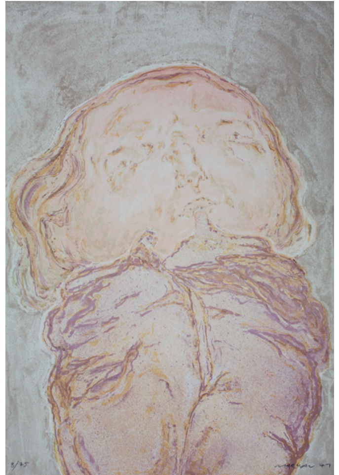
1. Kopf und Hose Farblithographie, 1971 84 x 58,4 cm