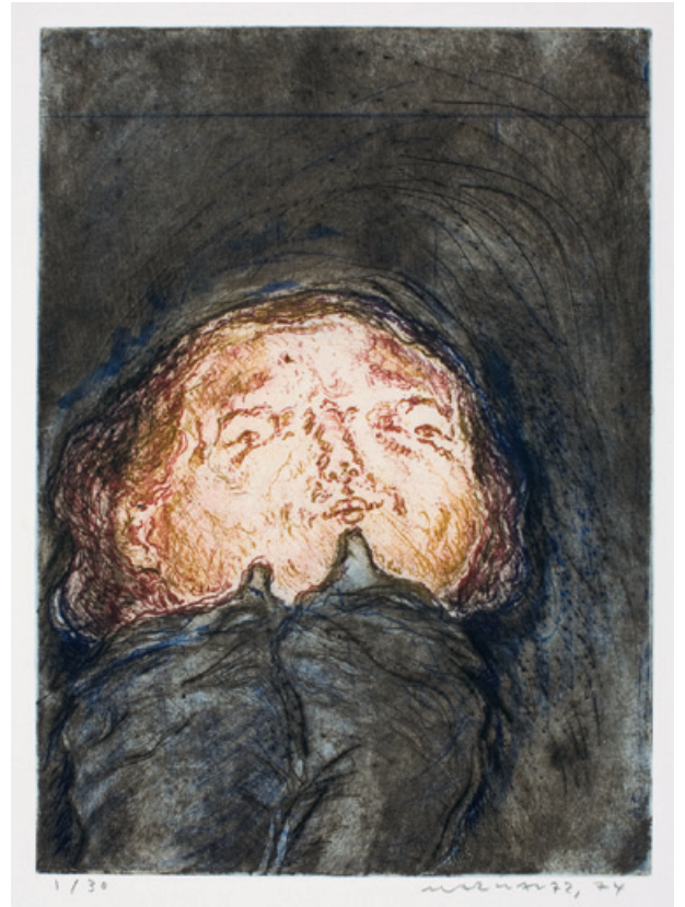
19. Kopf und Hose Vierfarbdruck, Verni mou, Kaltnadel, Aquatinta, 1972/74 33 x 23,5 cm