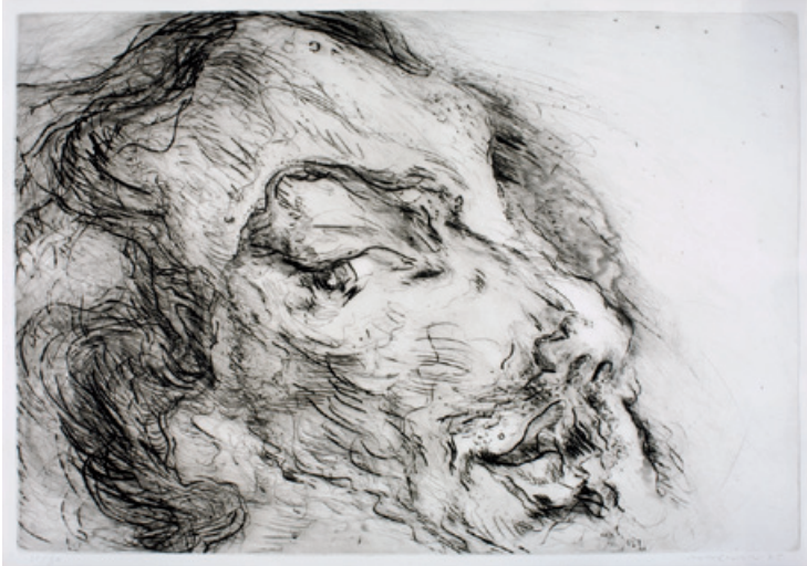
15. Gesichtslandschaft V Kaltnadelradierung, 1975 68 x 98 cm