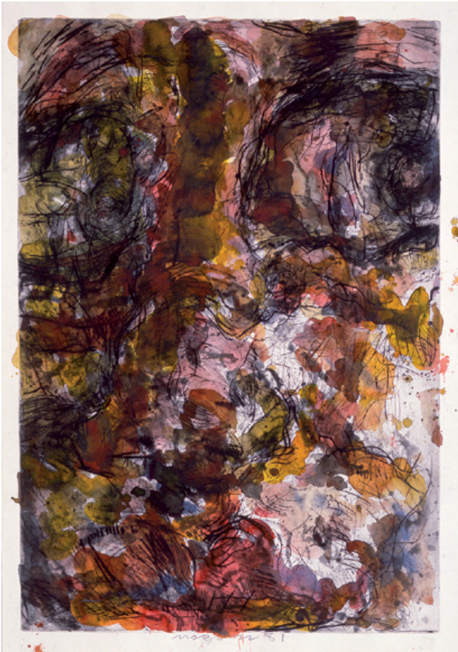
21. Kopf Kaltadelradierung und Aquatinta, aquarelliert 1981 100 x 68 cm