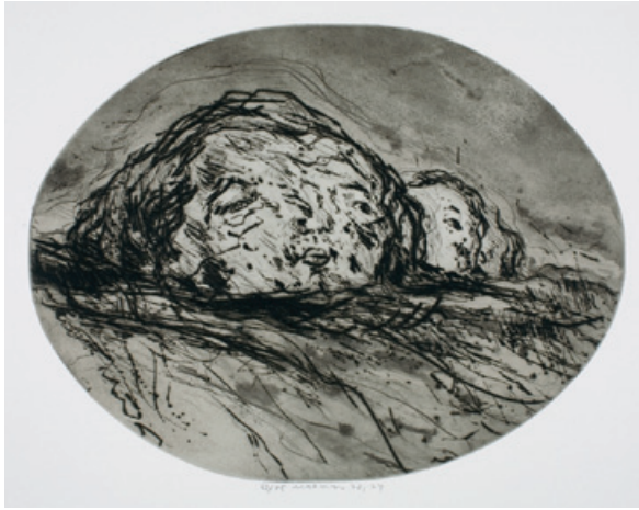
8. 2 Köpfe II Kaltnadelradierung, 1972/74 oval 38 x 49 cm