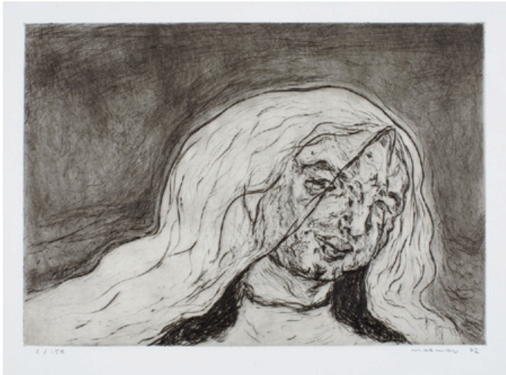
17. Gesicht mit Schleier III Kaltnadelradierung, 1973 34 x 49,5 cm