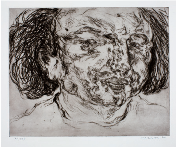
6. Gesicht I Kaltadelradierung, 1972 39 x 49,5 cm