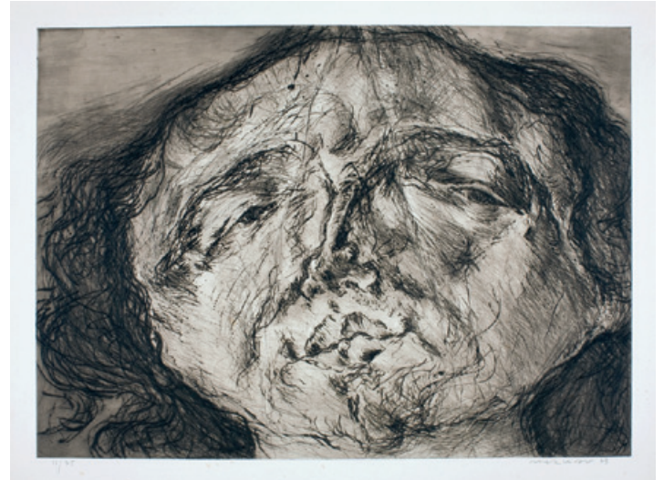
12. Gesichtslandschaft IV Kaltnadelradierung, 1973 43,5 x 59 cm