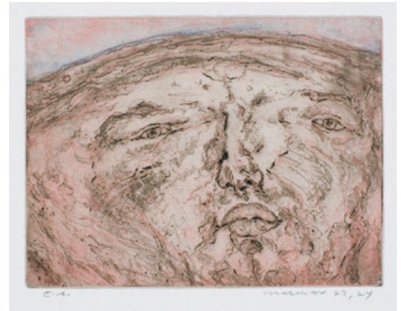
7. Gesichtslandschaft III Vierfarbdruck, Verni mou, Aquatinta, 1972/74 17,5 x 24 cm