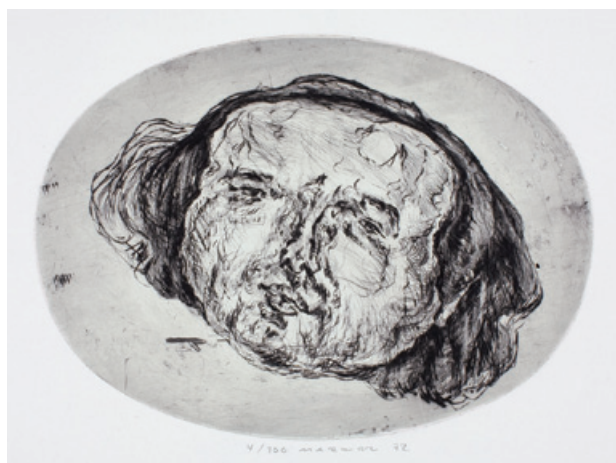
13. Kopf Kaltnadelradierung, 1972 oval 23 x 31,5 cm