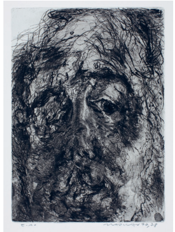
16. Kopf Kaltnadelradierung, 1977/78 48 x 33 cm