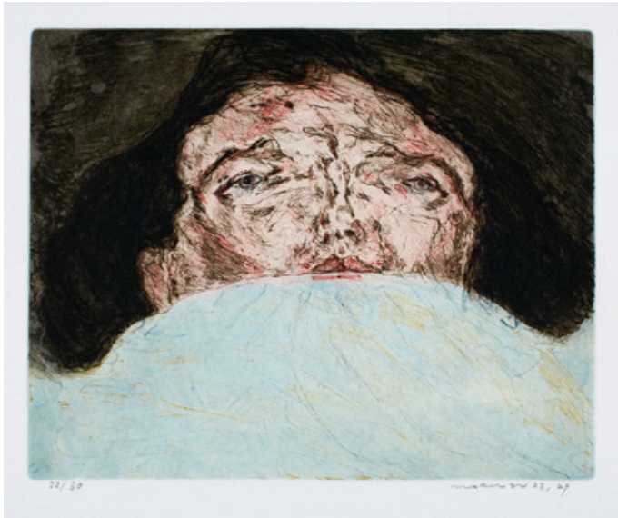
4. Im Bett Vierfarbdruck, Kaltnadel, Vernis mou, Aquatinta, 1972/74 30,5 x 39 cm