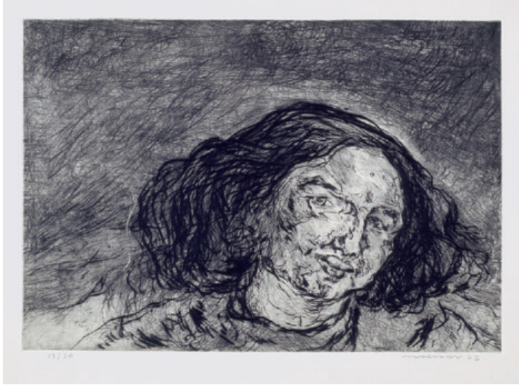
20. Gesicht II Kaltnadelradierung, 1972 34,5 x 49,5 cm