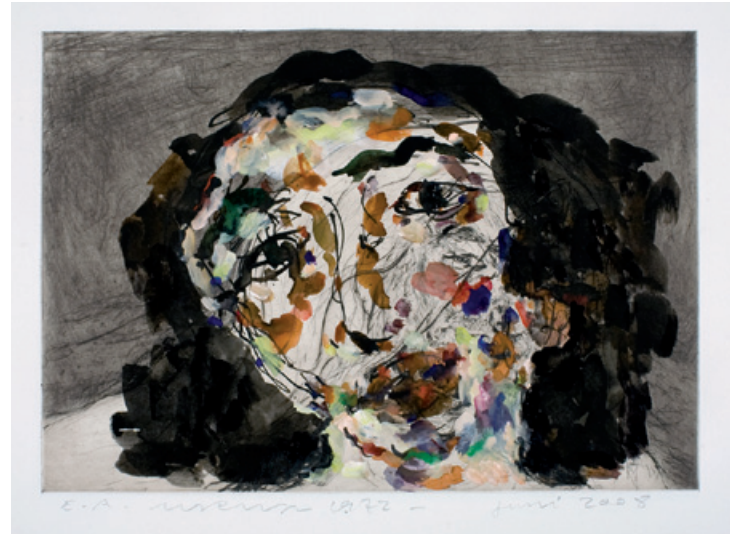
18. Gesicht mit Schleier III Kaltnadelradierung, 1973, aquarelliert 2008 34 x 49,5 cm