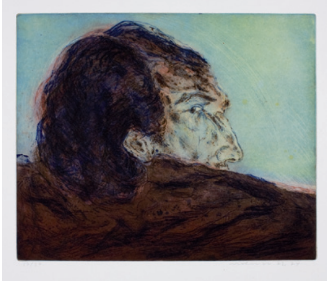
11. Kopf Vierfarbdruck, Kaltnadel, Aquatinta, 1972/74 34,5 x 42,5 cm