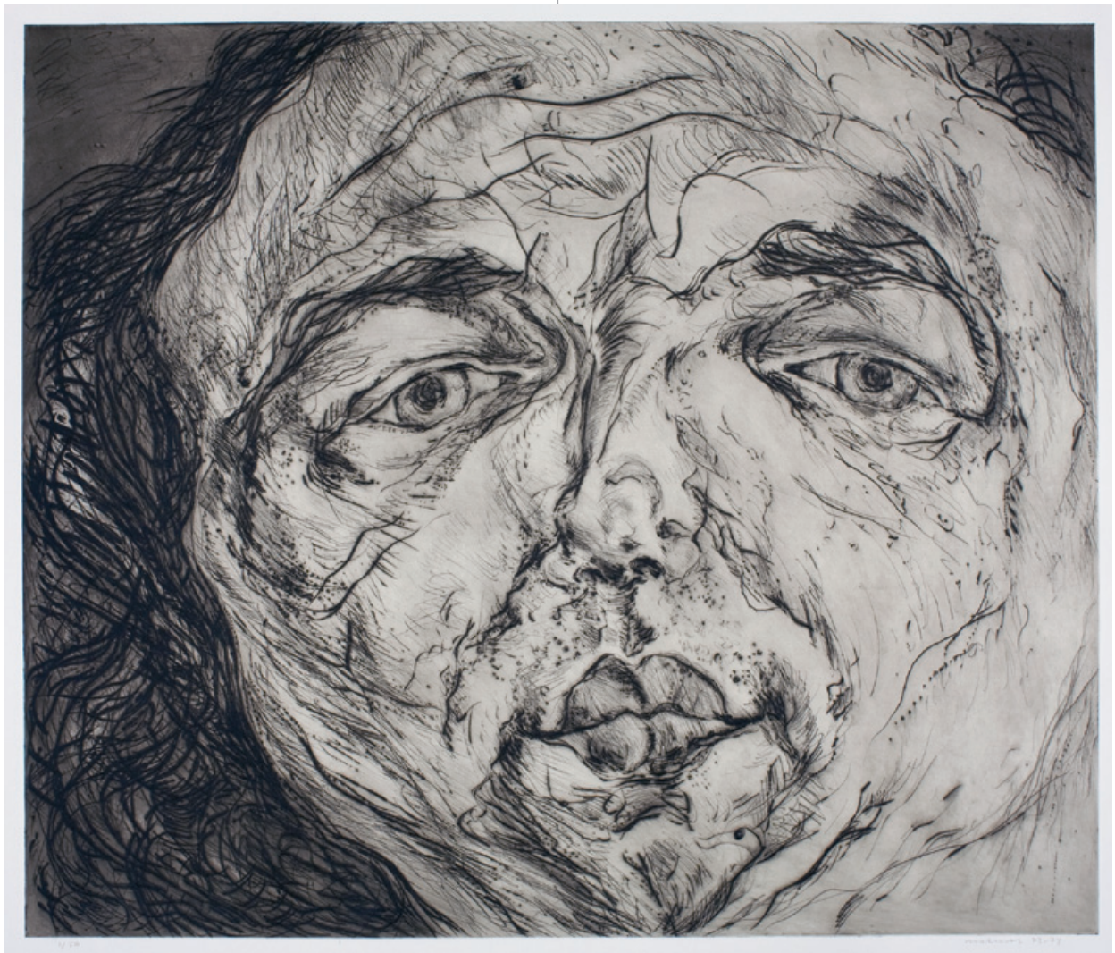
10. Gesichtslandschaft IV Kaltnadelradierung, 1973/74 69 x 80 cm