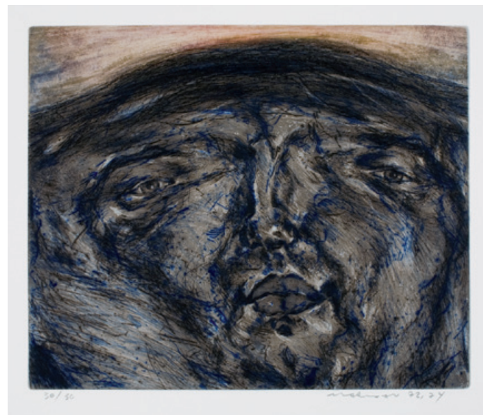
14. Gesichtslandschaft Vierfarbdruck, Kaltnadel, Aquatinta, 1972/74 34,5 x 43 cm