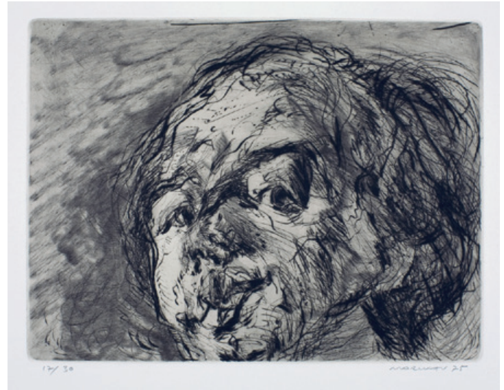
5. Kopf Kaltnadelradierung, 1975 29,5 x 39,5 cm