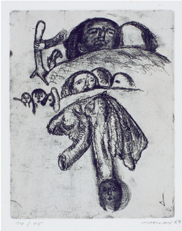
2. Kopf mit Decke Kaltnadelradierung, 1969 27,6 x 21,7 cm