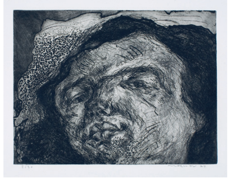
9. Kopf Kaltnadelradierung, 1974 29,6 x 39,5 cm